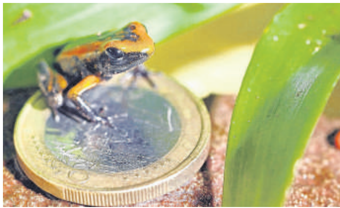
Ein Pfeilgiftfrosch-Baby sitzt auf einer Ein-Euro-Münze.

Über kleine Vereine wie z.B. Judo berichten.