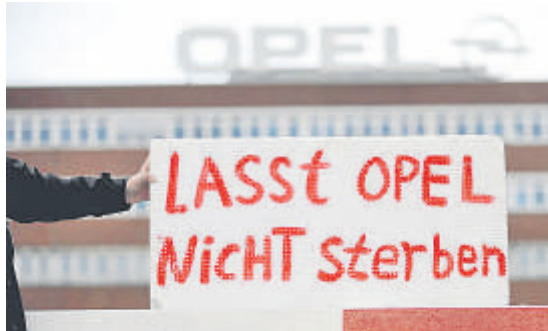
Viele Menschen, die bei der Firma Opel arbeiten, protestieren mit Plakaten.