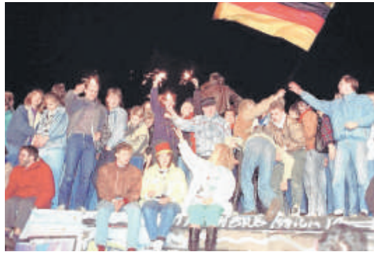
Vor 20 Jahren feierten viele Menschen an der Berliner Mauer den Mauerfall.

Auf dieser Seite erfahrt ihr mehr über die Grenze, die Deutschland lange teilte - und über die Mauer in Berlin. Vor 20 Jahren ist sie gefallen. Hier könnt ihr nachlesen, was das bedeutet.