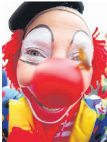
Zum Fasching gehören Clowns.

Auch heute wird in Deutschland noch Fasching gefeiert. Die wichtigste Faschingszeit kommt dabei aber erst noch. Es sind die sechs Tage, bevor der Fasching wieder zu Ende ist. Und das ist diesmal am 17. Februar. In Städten wie Köln oder Mainz wird dann erst richtig Karneval mit riesigen Karnevalsumzügen gefeiert. Bis dahin braucht ihr natürlich nicht warten. Galaktikus verrät euch, wo ihr ab nächsten Mittwoch Fasching feiern könnt.