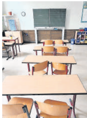
In Sachsen-Anhalt bleiben viele Klassenzimmer leer.

Schweinegrippe erkennt man an Müdigkeit, Fieber, Kopfschmerzen, Husten und Halsschmerzen. Hat man diese Beschwerden,