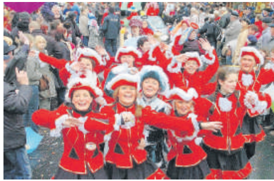
Zum Fasching wird viel gefeiert.

Alle Narren und Närrinnen aufgepasst! Ab nächsten Mittwoch wird wieder Fasching gefeiert. Am 11.11. pünktlich um 11.11 Uhr geht die fröhliche Zeit mit Verkleiden und Karnevalsumzügen wieder los und bis zum 17. Februar könnt ihr diesmal feiern.