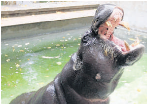
Das Zwergflusspferd Hannibal

Was könnte Galaxo noch besser machen? Kochrezepte veröffentlichen.