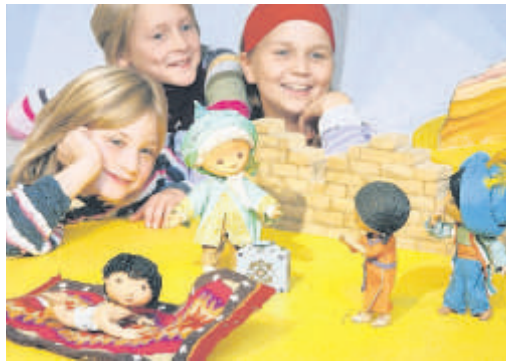
Kinder bei der Sandmann-Ausstellung

Wer kennt ihn nicht, den Sandmann? Jeden Abend bringt er viele Kinder in Deutschland ins Bett. Und in diesem Jahr wird der Sandmann 50 Jahre alt. Pünktlich zum Geburtstag gibt es jetzt im Filmmuseum in Potsdam eine Ausstellung zu sehen.