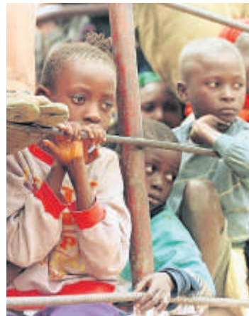
Kinder auf der Flucht

Viele der Kinder dürfen erst einmal bleiben, bis sie 16 Jahre alt sind. Dann kann es passieren, dass sie in ihre Heimatländer zurückgeschickt werden. Das wollen Politiker jetzt ändern. In Zukunft sollen Flüchtlingskinder bis zum Alter von 18 Jahren in Deutschland bleiben dürfen.