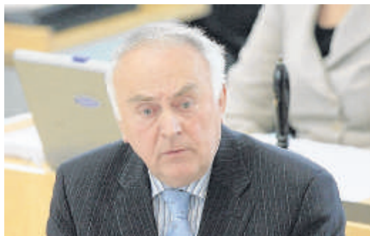
Ministerpräsident Wolfgang Böhmer will die Bürger besser informieren.

Wie zufrieden sind die Bewohner von Sachsen-Anhalt und was denken sie über ihre Zukunft? Was halten sie von den Politikern in ihrem Bundesland? Das kann der Sachsen-Anhalt Monitor beantworten. Diese Umfrage wurde gerade zum zweiten Mal gemacht.