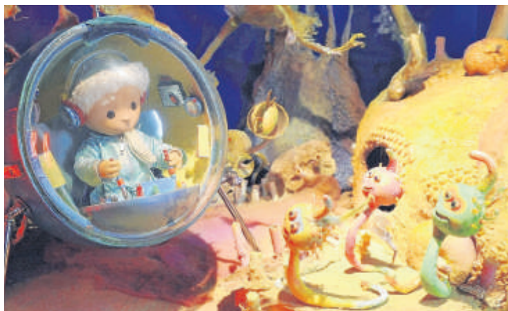
Der Sandmann in einer Raumkapsel

@ Mehr dazu im Internet: www.filmmuseum-potsdam.de