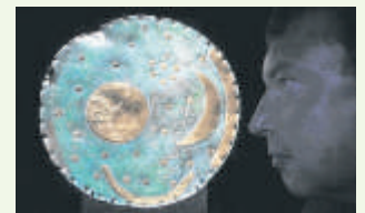
Ein Besucher vor der Himmelscheibe

Am Sonntag ist Familientag in der Arche Nebra. Dort könnt ihr an einer Führung teilnehmen und so erfahren, wie die berühmte Himmelscheibe entdeckt wurde. Um 14 Uhr könnt ihr dann beim Scheibenduell mitmachen. Bei diesem Spiel treten zwei Teams gegeneinander an. Sie sollen Rätsel rund um die Himmelscheibe lösen.