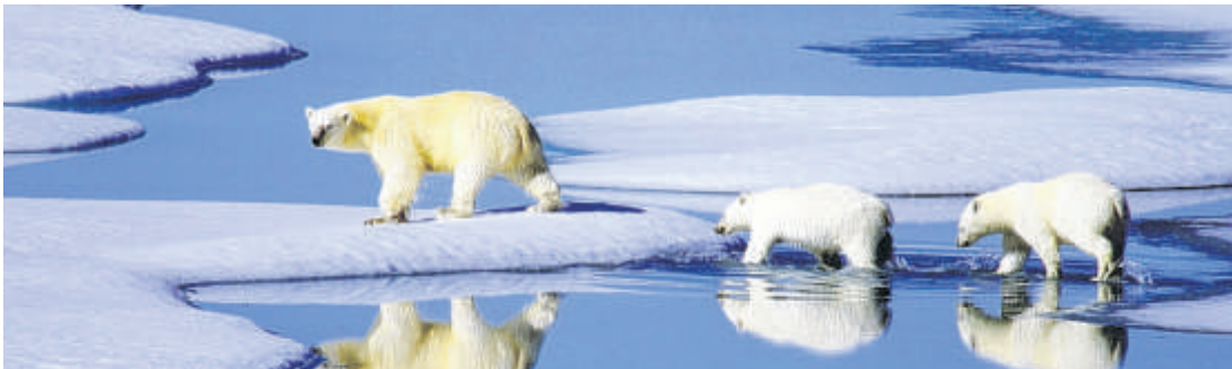
Diese Eisbärenfamilie läuft über Eisschollen. Eine Menge Eis ist schon geschmolzen.

Arved Fuchs hat die Menschen im Nordwesten Grönlands dazu befragt. Er sagt: Früher gab es dort über mehrere Jahre hinweg durchgängig eine dicke Eisschicht. Das ist jetzt nicht mehr so. Für die Menschen dort ist das schlecht. Viele jagen auf dem Eis und können darauf mit Schlitten weite Strecken zurücklegen. Dafür muss das Eis aber dick genug sein. Das ist es jetzt an vielen Stellen nicht mehr.