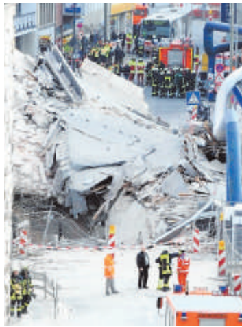
Viele Helfer suchen nach den beiden Vermissten.

hielten sich zu dieser Zeit im Kölner Stadtarchiv auf. Sie konnten sich zum Glück gerade noch retten. Trotzdem werden noch zwei weitere Menschen vermisst. Sie waren wahrscheinlich in den Wohnungen des Nachbarhauses, als das Unglück geschah. Das Haus stürzte ebenso komplett ein. Feuerwehrleute und