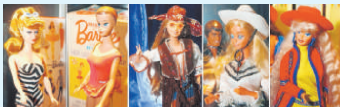
So sahen die Barbies in den fünf Jahrzehnten aus.

ben. Ihr Aussehen veränderte sich in den vergangenen Jahrzehnten. Heute schaut sie ein bisschen freundlicher drein.