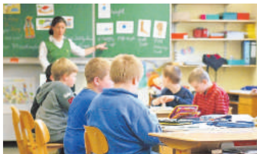
Schüler sind nicht immer so ruhig.

Wenn Schüler viel quatschen, schimpfen die Lehrer. Manche Schüler bekommen auch eine Strafe. Doch eine Lehrerin in Dessau-Roßlau ging zu weit. Sie klebte Schülern den Mund zu. Nun hat sie ihren Job verloren.