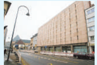
Das Kölner Stadtarchiv vor dem Einsturz.

Uralte Dokumente, Schriftrollen, Fotos, Urkunden, Bücher und vieles mehr findet man in einem Stadtarchiv. Hier wird alles aufbewahrt, was mit der Geschichte einer Stadt zu tun hat. Manches davon ist mehrere hundert Jahre alt und deswegen besonders wertvoll. Häufig wird ein Stadtarchiv auch als „Gedächtnis“ einer Stadt bezeichnet. Klar, dass keine größere Stadt ohne solch ein Gedächtnis auskommt. Vor allem für Menschen, die sich mit der Vergangenheit einer Stadt beschäftigen möchten, ist ein Stadtarchiv sehr wichtig.