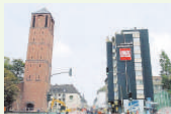
Der „Schiefe Turm von Köln“

rutscht, das Gebäude sackte ab. Mitarbeiter des Archivs haben berichtet, dass es schon seit Beginn des Baus Risse und andere Schäden im Gebäude