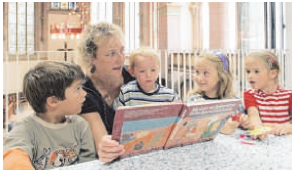
100 Vorleser sollen an 100 Tagen in 100 Orten in ganz Deutschland vorlesen.

Viele Menschen hören gerne zu, wenn ihnen vorgelesen wird. Aber wusstet ihr, dass es für die besten Vorleser sogar einen Preis gibt? Es ist der Deutsche Vorlesepreis. Bevor er in diesem Jahr in Köln vergeben wird, startet ein Weltrekordversuch.