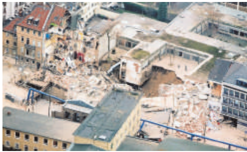
Wo das Stadtarchiv in Köln früher stand, ist nur noch ein großes Loch.

Am Dienstagnachmittag passierte in Köln etwas Unglaubliches. Das Gebäude des Kölner Stadtarchivs stürzte komplett ein. Mehrere Menschen konnten sich in letzter Sekunde in Sicherheit bringen. Zwei Menschen werden aber noch vermisst.