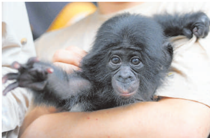
Dieser kleine Affe aus England wohnt jetzt in Frankfurt.