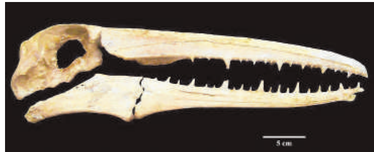
So sehen Kopf und Schnabel des Vogels aus.

Die Forscher wollen ihren Fund nun genauer untersuchen. Sie hoffen, dass sie so mehr über den Vogel lernen werden. Manche Forscher glauben, dass die Pelagornithiden mit heutigen Pelikanen verwandt sind. Andere Forscher meinen eher, dass sie zu den Enten gehören.