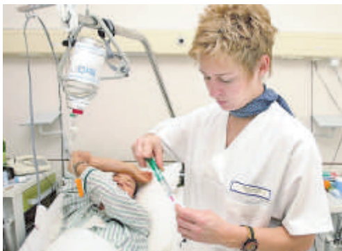
Krankenschwestern sollen mehr Gehalt verdienen.