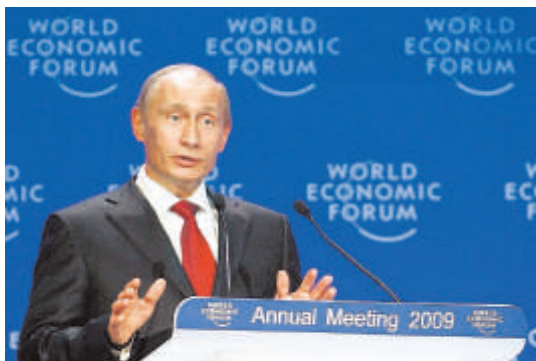
Russlands Ministerpräsident Vladimir Putin eröffnete das Wirtschaftsforum.

Zurzeit geht es vielen Unternehmen nicht so gut. Sie stecken in einer Krise. Diese Krise wird Wirtschaftskrise genannt. Darüber wird viel berichtet. In der Schweiz treffen sich nun Politiker und Firmenchefs, um zu überlegen, was man dagegen machen kann.