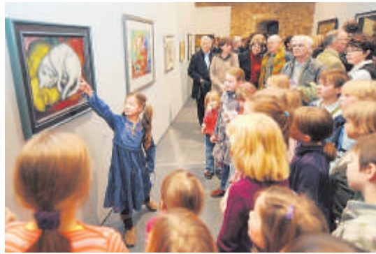
Ein Kind zeigt anderen Kindern in der Moritzburg ihr Lieblingskunstwerk.

Über Ferien freuen sich zurzeit viele Schüler in Sachsen-Anhalt. Einige Kinder fahren in den Urlaub. Doch auch diejenigen, die zu Hause bleiben, müssen sich nicht langweilen. In Halle bieten die Moritzburg und das Kindermuseum interessante Veranstaltungen an.