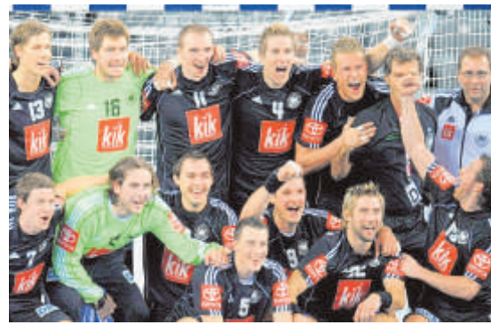
Die deutsche Nationalmannschaft freut sich über ihren fünften Platz bei der WM.

2007 wurden die deutschen Handballer Weltmeister. In diesem Jahr hat es nur zu Platz fünf gereicht. Millionen Fans sind enttäuscht, denn sie hatten sich mehr erhofft. Trainer Heiner Brand ist trotzdem stolz auf sein Team. Wütend ist er nur auf die Schiedsrichter.