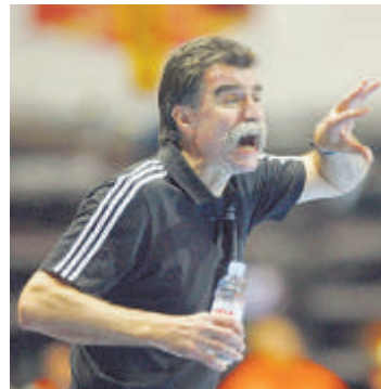
Bundestrainer Heiner Brand kann richtig wütend werden.

es eigentlich üblich ist. Das deutsche Team bekam keine Chance zum Ausgleich. Trainer Heiner Brand wurde richtig sauer. Er stürmte mit erhobener Faust auf die Schiedsrichter zu und konnte sich nur mit Mühe zurückhalten.