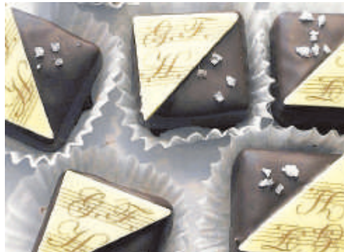
Das ist die Händel-Praline.

Georg Friedrich Händel ist ein berühmter Komponist. Er wurde vor etwa 320 Jahren in Halle geboren. Die Stadt feiert ihn und seine Musik jedes Jahr mit einem großen Fest. Das sind die Händelfestspiele. In diesem Jahr gibt es noch etwas Besonderes: eine Händel-Praline.