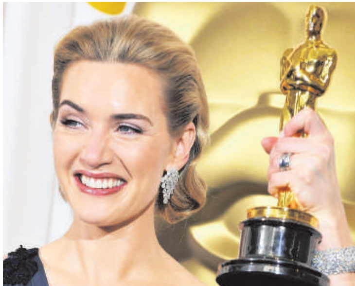
Kate Winslet bekam den Oscar als „Beste Hauptdarstellerin“.

Die Verleihung einer Auszeichnung war diesmal besonders traurig. Der Schauspieler Heath Ledger (sprich: Hieß Ledtscher) bekam auch einen Oscar. Er wurde für seine Nebenrolle in einem Film über den Comic-Helden Batman (sprich: Bettmenn) ausgezeichnet. Doch Heath Ledger ist vor etwa einem Jahr gestorben. Sein Vater nahm den Preis für ihn entgegen.