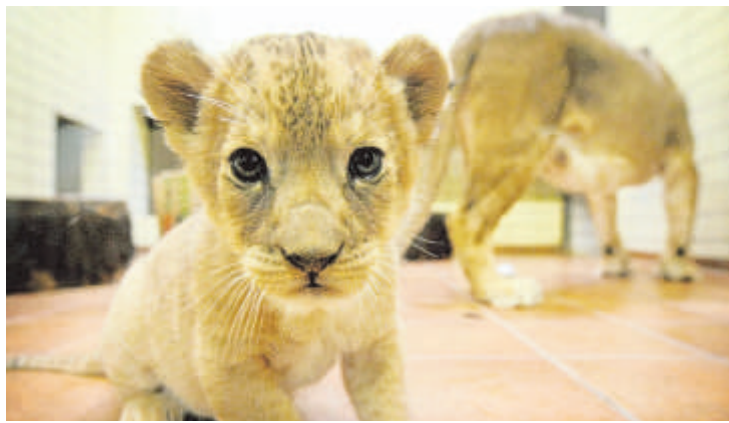
Das ist eins der Löwenbabys aus Dortmund.