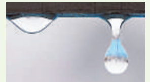
Ein Wassertropfen geht auf Reisen.

Habt ihr Lust, mal bei einem Musical mitzuspielen? Ein Musical ist ein Theaterstück, bei dem viel gesungen und getanzt wird. In Weißenfels könnt ihr euer Talent unter Beweis stellen. Dort werden