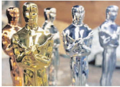
So sehen die Oscars aus.

Am Wochenende wurden in Amerika wieder die wichtigsten Filmpreise der Welt verliehen: Es sind die Oscars. Schauspieler und Filmemacher wurden für besonders gute Leistungen ausgezeichnet. Ein Film bekam gleich acht Preise.