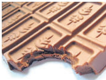
40 Tage ohne Schokolade: Würdet ihr das schaffen?

Viele Menschen verzichten heute in der Fastenzeit auf andere Dinge. Sie fahren zum Beispiel