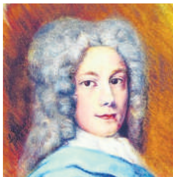
So sah Händel aus.

beschäftigen. Außerdem gibt es eine Händel-Praline. Sie wird aus Toffees, Haselnüssen und Salz gemacht. Die Firma Halloren hat sie erfunden.