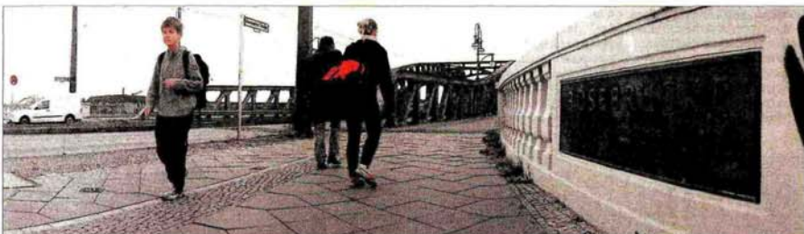
Vor dem ehemaligen Berliner Grenzübergang Bornholmer Brücke