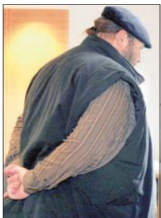
Der ehemalige Halberstädter Domküster gestern vor der Urteilsverkündung in Magdeburg. Er muss wegen Drogenhandels viereinhalb Jahre in Haft.

Der Domküster war 18 Jahre beim Kirchspiel Halberstadt beschäftigt. Als Küster und Hausmeister war er für alle Gebäude und Grundstücke des Kirchspiels Halberstadt zuständig.