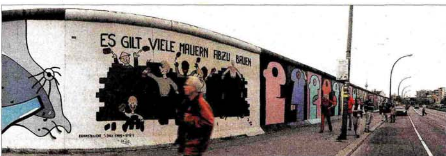
Seit Jahren viel besuchtes Kunstobjekt: die East Side Gallery mitten in Berlin.