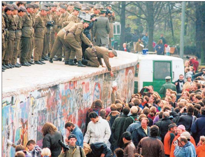
Nach der Grenzöffnung im November 1989 spielten sich bis dahin unvorstellbare Szenen ab. DDR-Grenzposten sehen sich dabei einem Ansturm von Bürgern und Journalisten auf der West-Berliner Seite gegenüber.