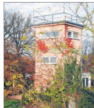
Einst Führungsturm der Grenztruppen, heute Ferienwohnung: Mieten will sie aber niemand.

setzte im Sommer 1989 eine bis dahin ungekannte Massenfluchtbewegung ein. Am 18. Oktober 1989 musste Partei- und Staatschef Erich Honecker unter dem Druck der öffentlichen Proteste zurücktreten, wie wenige Tage später die vollständige DDR-Regierung. Am 9. November wurde zunächst die Berliner Mauer geöffnet, dann viele andere Grenzübergänge. Von nun an gab es keine Beschränkungen mehr im innerdeutschen Reiseverkehr.