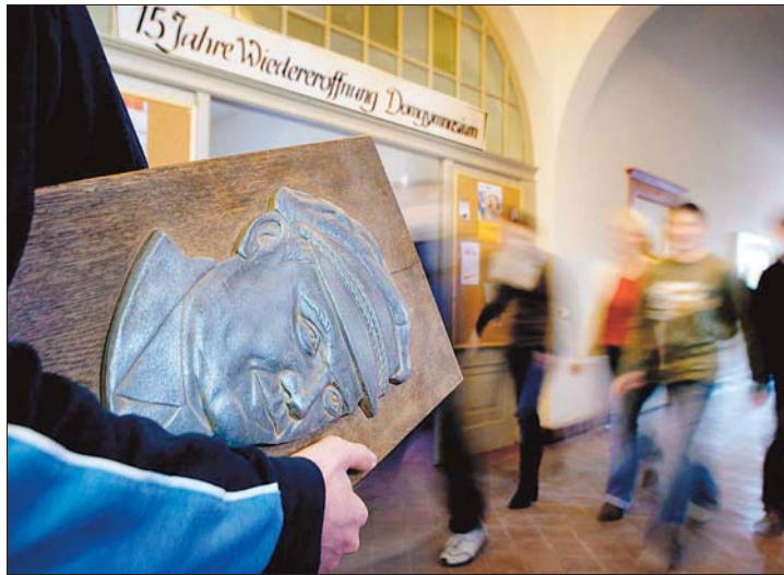
Ein Schüler hält am Merseburger Domgymnasium ein Ernst-Thälmann-Relief. Die Jugendlichen, mit denen die MZ dort sprach, konnten mit dem Namen des Arbeiterführers nichts anfangen.