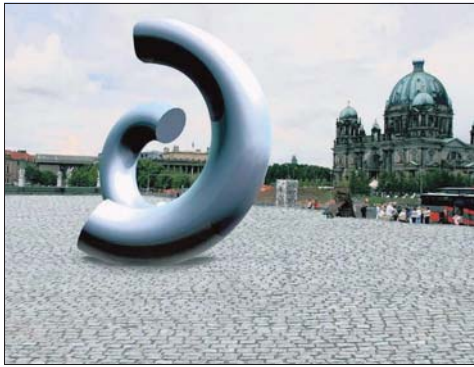
Der Entwurf der Kommunikationsdesignerin Bernadette Boebel, der sich in einem ersten Wettbewerb durchsetzte, besteht aus zwei halbringförmigen Stahlteilen, die sich von einem bestimmten Punkt aus zu vereinen scheinen.