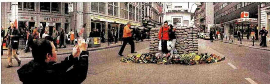
Beliebtes Fotomotiv bei Berlinbesuchern ist jener Ort, der als Check Point Charly bekannt wurde.