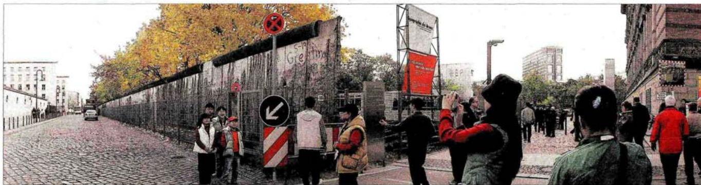
Von der Mauer, die bis 1989 Berlin teilte, ist kaum noch etwas zu sehen. Das größte erhaltene Stück steht in der Niederkirchner Straße und wird täglich von Touristen besucht.